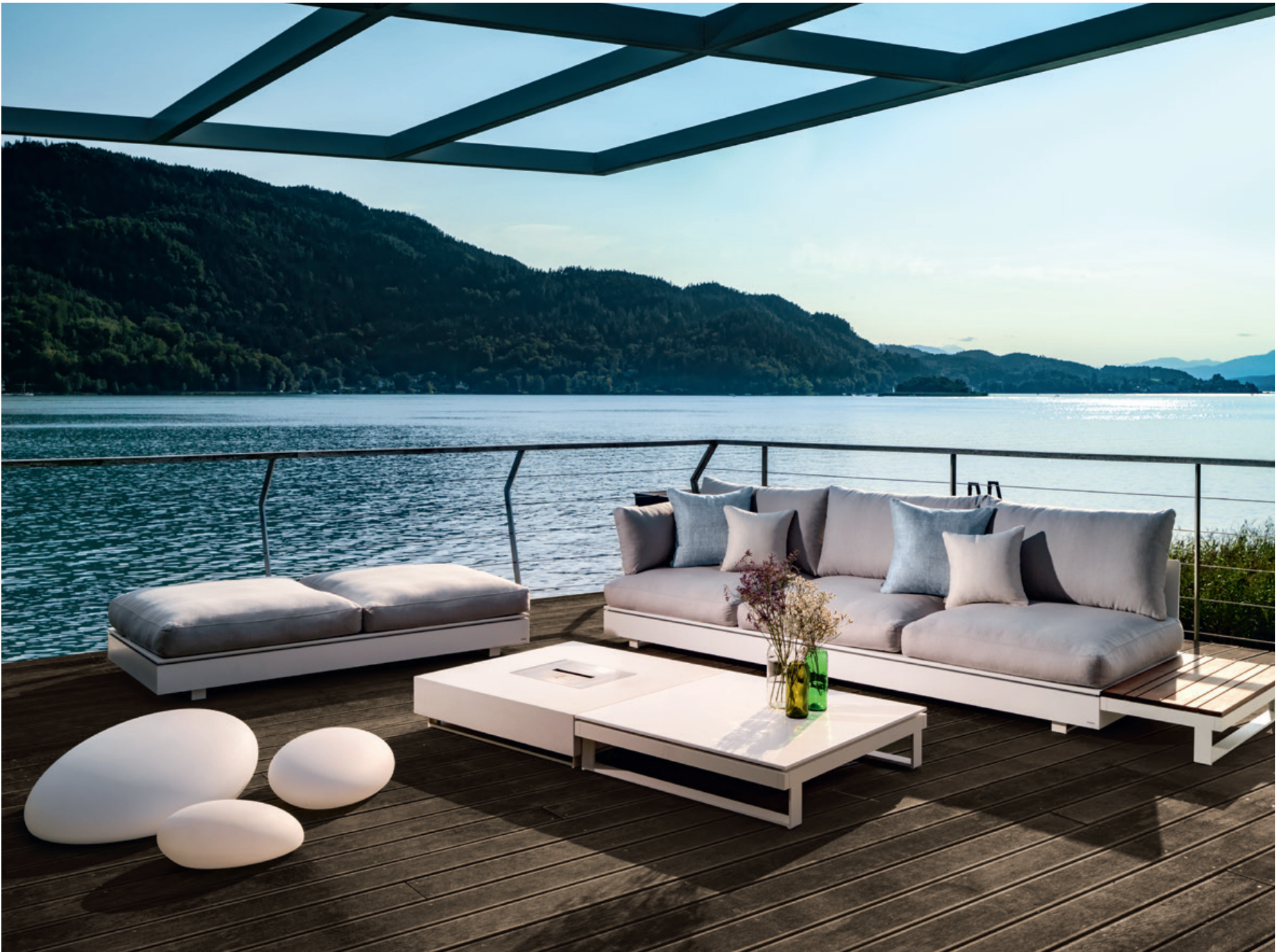
▲ Mach's dir bequem: Kollektion Pure von Viteo.

Die frischen Düfte genießen, die Seele baumeln und sich den Wind um die Nase wehen lassen – das Paradies auf Erden ist zum Greifen nah. In der Grazer Chillout Area weiß man, wie das geht.