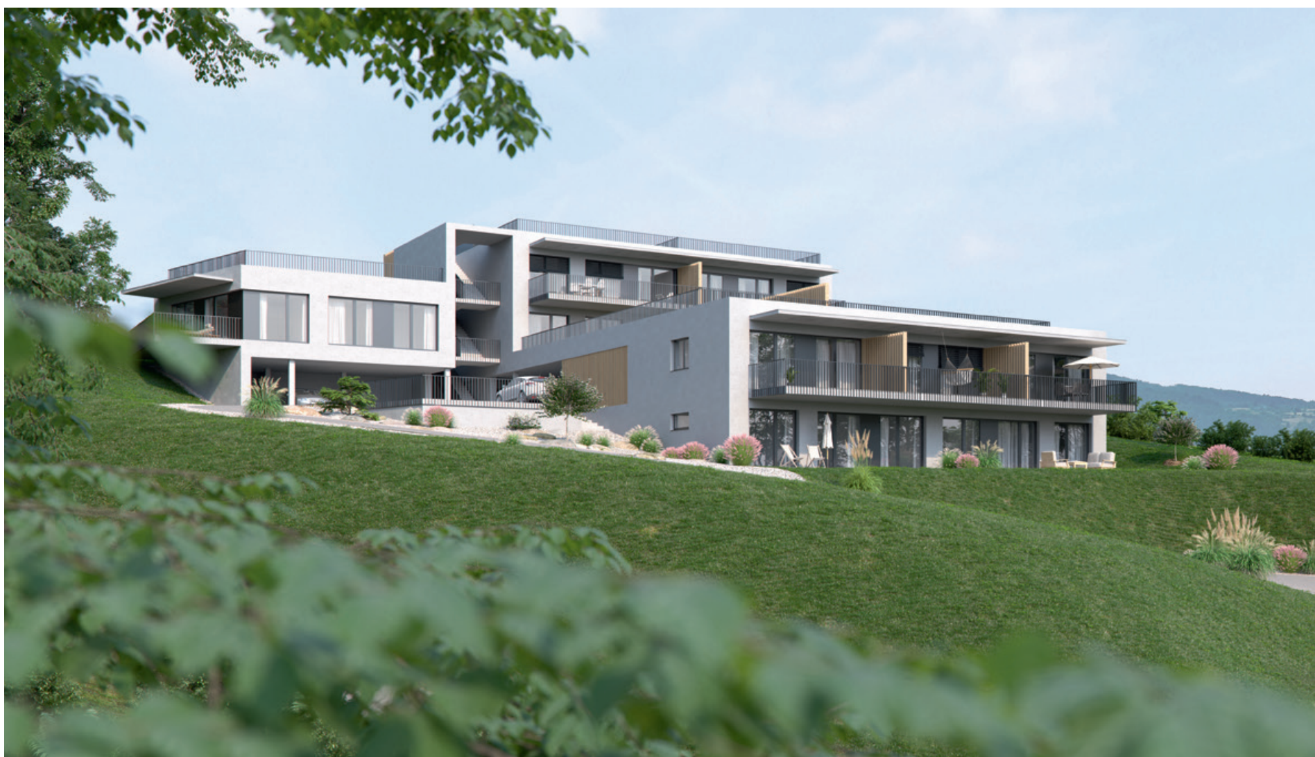
▲ Traumwohnungen mit Ausblick am Pfanghofweg in Graz-Andritz.

Rundum sorgenlos zum maßgeschneiderten Immobilieninvestment: Das garantiert das umfassende Service-Paket der IMMOLA Home & Living GmbH.