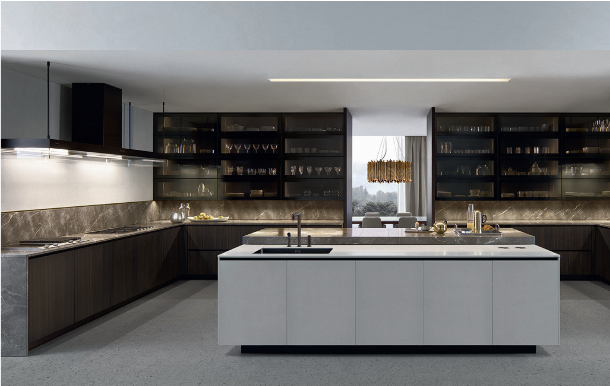
◀ Küche Alea von Poliform.