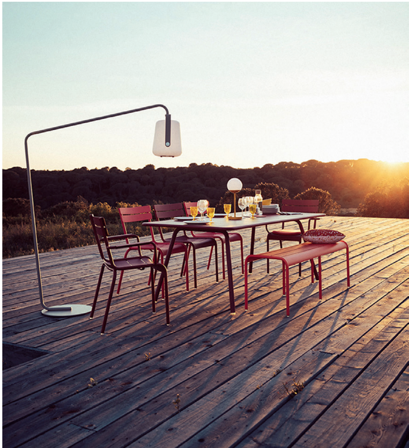
▲ An alles gedacht: Kollektion Luxembourg von Fermob.

Nur ein perfekt geplanter und gemütlicher Freiraum lädt zum genussvollen Verweilen ein. Um für eine Terrasse von Beginn gleich das Richtige zu entscheiden, empfiehlt es sich, die fachliche Be-