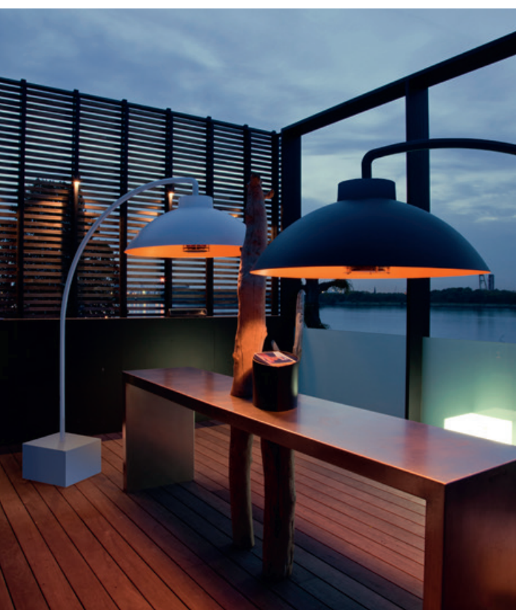
▲ Licht und Wärme in einem: Dome von Heatsail.

Chillout Area GmbH Palais Trauttmansdorff Burggasse 4 | 8010 Graz T. +43 660 7056550 office@chillout-area.com www.chillout-area.com