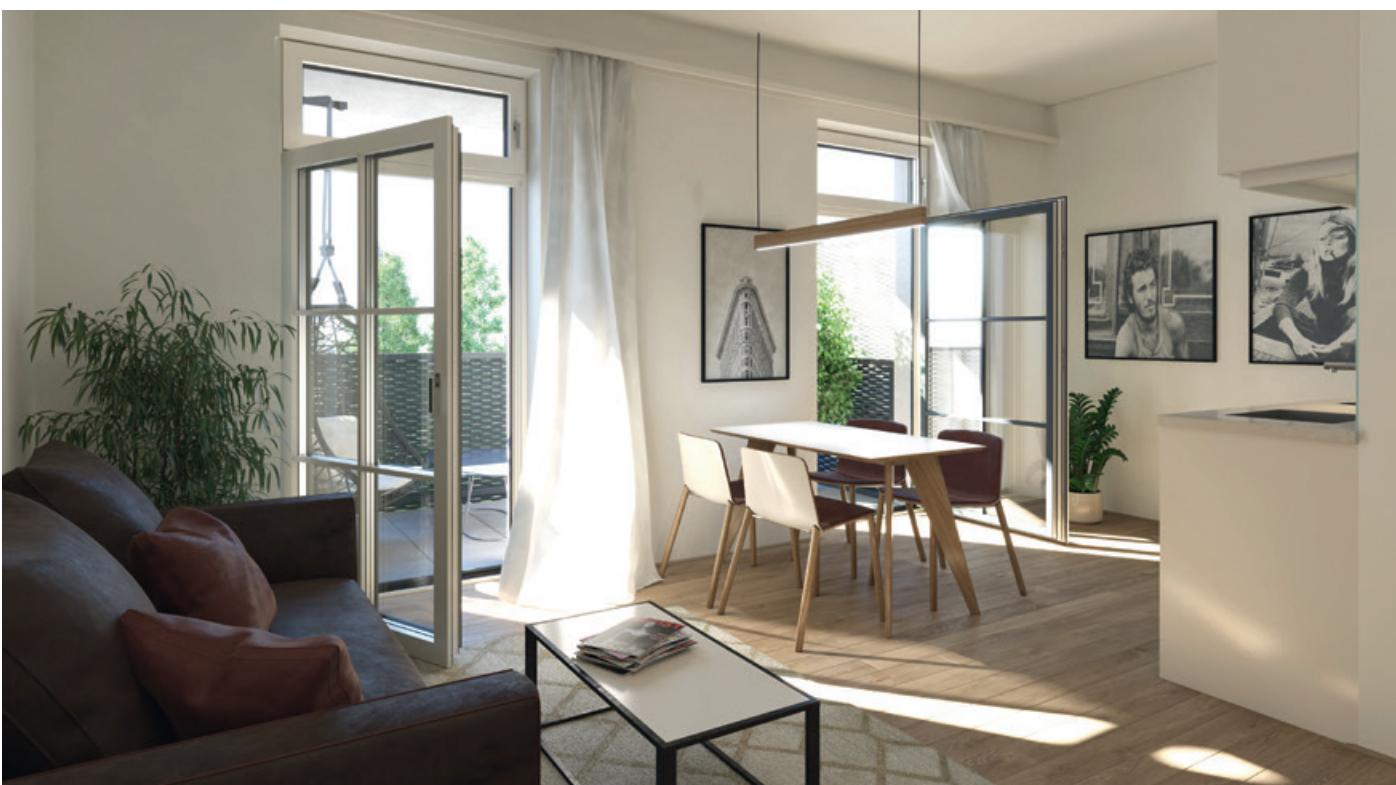
▲ Urbanes Vorzeigeprojekt in der Grazer Ungergasse.