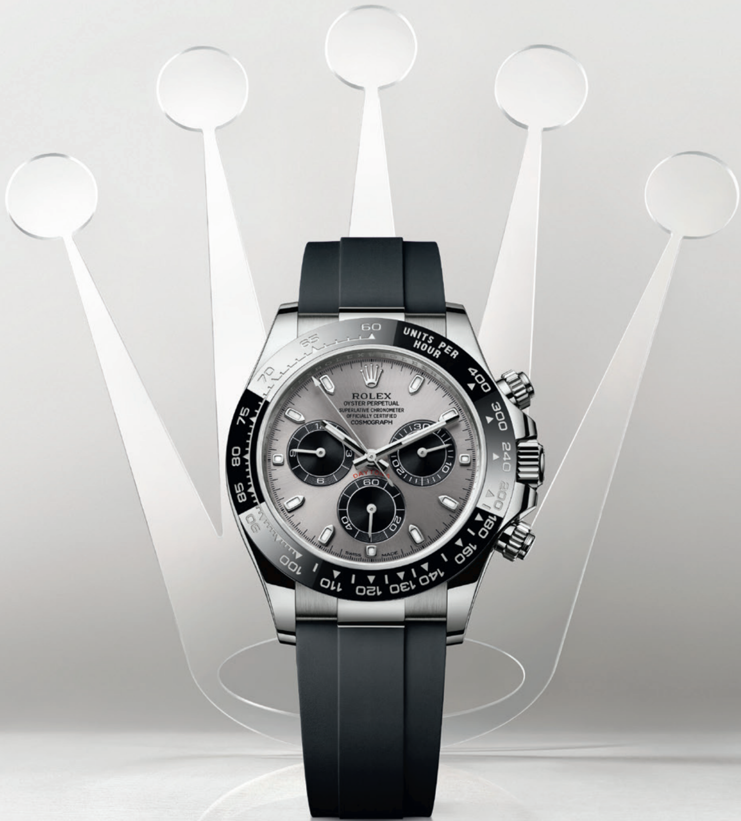
OYSTER PERPETUAL COSMOGRAPH DAYTONA IN 18 KARAT WEISSGOLD

Konzipiert für den Motorsport, ist diese Armbanduhr tief verwurzelt in der Geschichte des Rennsports und dank herausragender Uhrmacherkunst die Legende unter den Chronographen. Rolex. Sie zählt nicht nur die Zeit. Sie erzählt Zeitgeschichte.