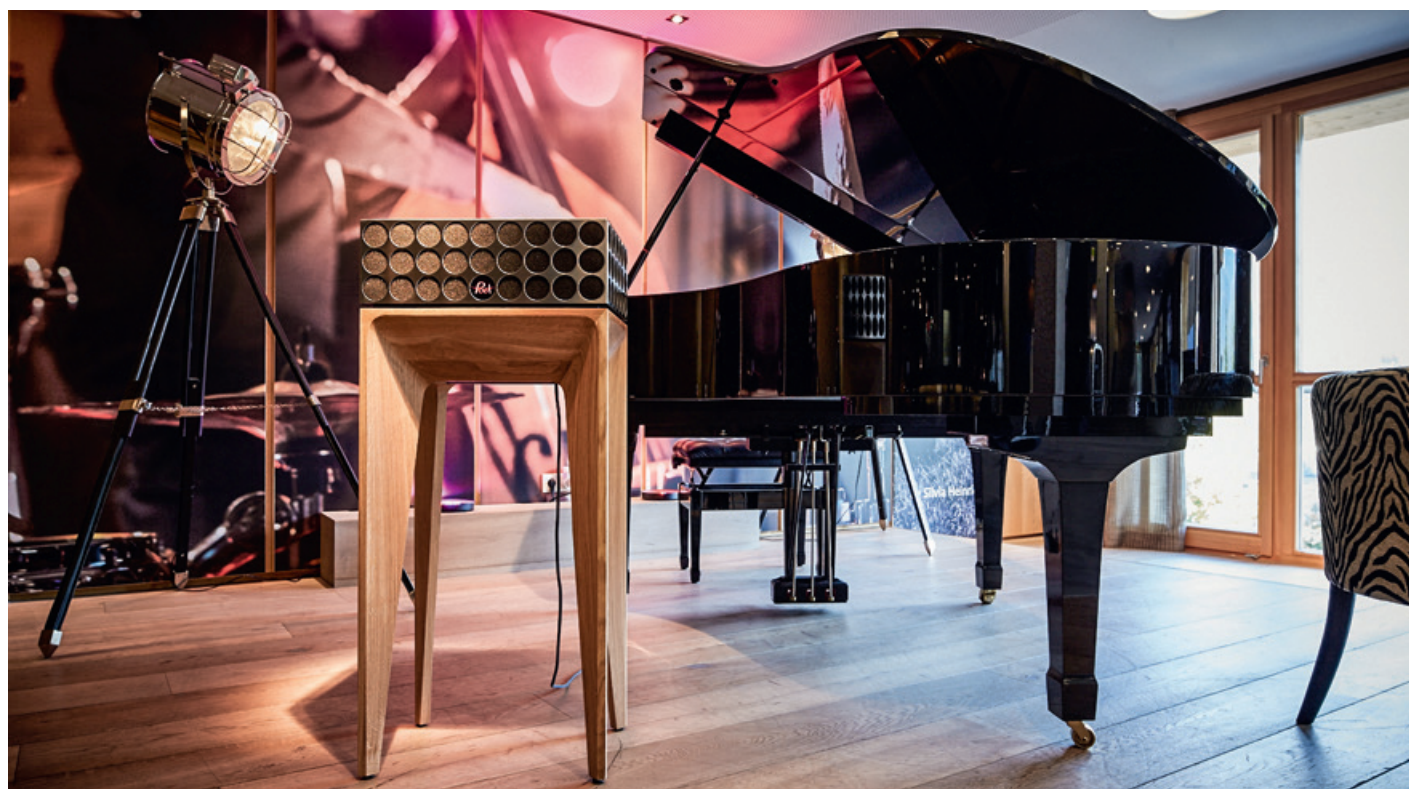
▲ pandoretta°: revolutionäre Optik einer echten HiFi Anlage mit 360°-Sound.

E. office@poetaudio.com • W. www.poetaudio.com T. +43 664 540 5991, Hr. Markus Platzer, GF