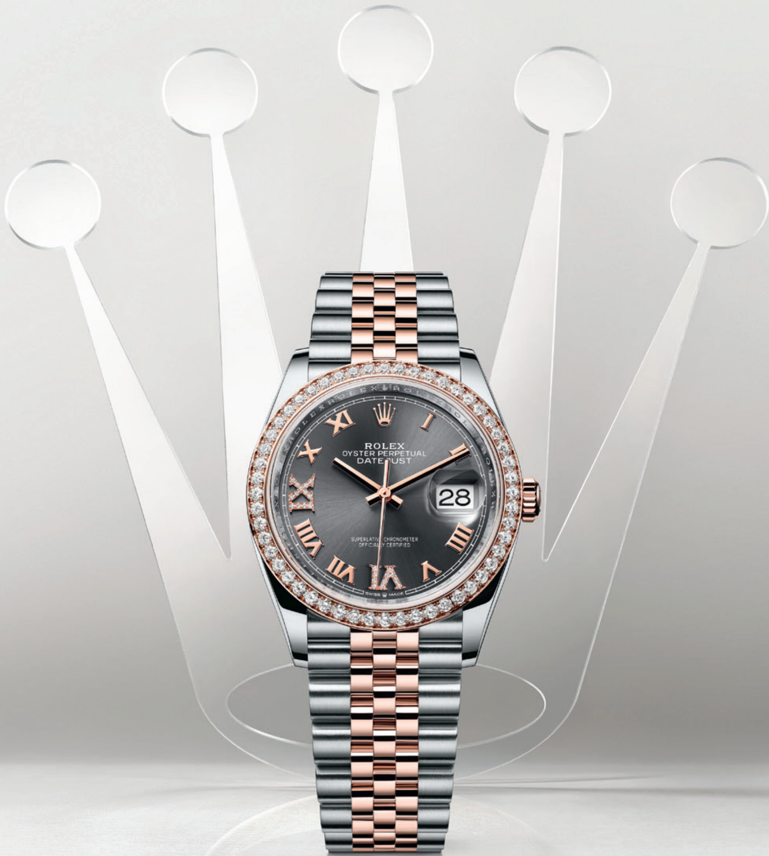
OYSTER PERPETUAL DATEJUST 36

Der Archetyp der modernen Armbanduhr schlägt seit 1945 Brücken über Generationen durch beständige Funktionalität und zeitlose Ästhetik. Rolex. Sie zählt nicht nur die Zeit. Sie erzählt Zeitgeschichte.